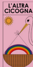
Associazione L'altra Cicogna