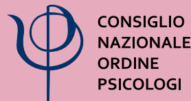
Consiglio Nazionale Ordine Psicologi