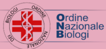
Ordine Nazionale Biologi