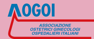
Associazione Ostetrici Ginecologici Ospedalieri Italiani